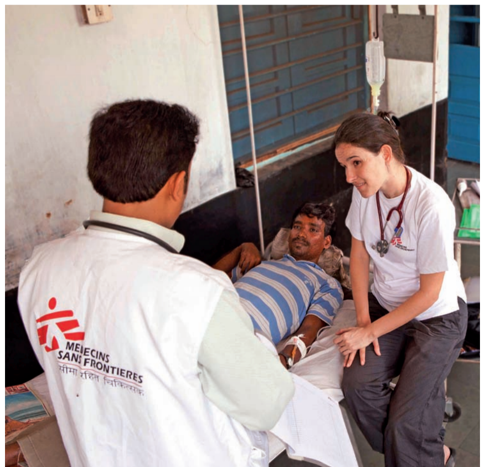
Un paciente recibe tratamiento para el Kala Azar en el hospital de Hajipur (India).