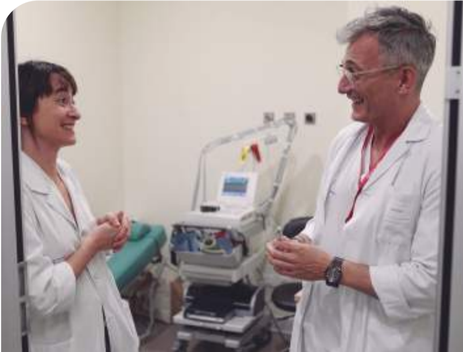
12:30 h. El supervisor charla con una investigadora de la universidad, que desarrolla un estudio en el servicio de Obstetricia y Ginecología del hospital.