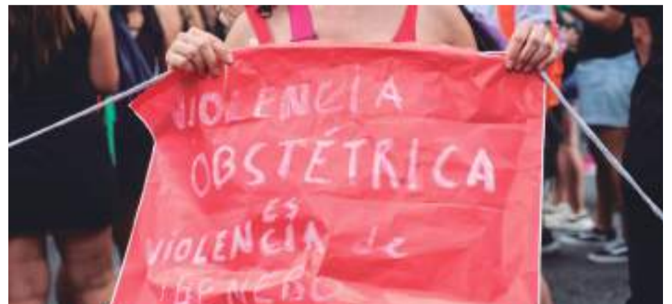
El movimiento de denuncia de las mujeres ha sido clave para dar visibilidad a lo que antes era silenciado, según la matrona.

La Asamblea Parlamentaria del Consejo de Europa ya la incluyó en su Resolución 2306 de 2019, donde se identifican una serie de prácticas y comportamien-