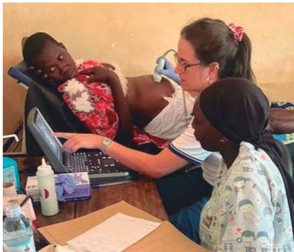
La matrona combina su labor clínica con proyectos de cooperación en Uganda, donde forma a profesionales en ecografía básica.

En nuestro país, lamenta, la formación en ecografía para matronas aún no está plenamente reconocida. “Falta un marco oficial que respalde nuestra competencia. Muchas compañeras se forman por iniciativa propia, pero sin itinerarios reglados”, señala. Para avanzar, propone una apuesta institucional que combine programas acreditados y prácticas tuteladas. “Más allá de la