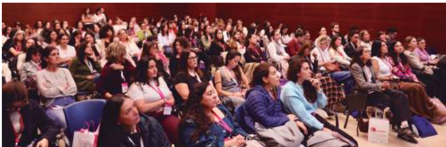
El XXIII Congreso de FAME reunió en San Sebastián a más de 1.400 matronas procedentes de todo el país, en un encuentro marcado por la ciencia y la emoción profesional.

La presidenta quiso, además, lanzar un mensaje de gratitud a quienes no pudieron acudir: “Aunque no estuviéramos físicamente juntas, su presencia estuvo en cada ponencia y en cada reflexión. Todas forman parte de este avance colectivo que fortalece nuestra profesión” .